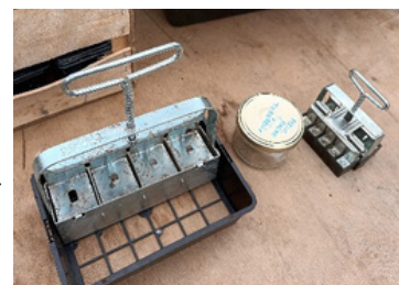
La mini-motte c'est comme le godet, pour faire ses plants, le plastique en moins !

Finir de ramasser les choux de Bruxelles