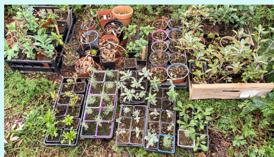
une adhérente a anticipé cet échange en bouturant ses plantes à l'automne

Le troc est vieux comme le monde, et pour dénicher des plants ou des boutures sans dépenser un centime, essayez le troc plantes de la SH79 ! l'échange est gratuit entre jardiniers et commence au gong à 9h, il faut arriver avant pour s'installer !