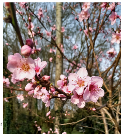
pêcher en fleur

Poser les bandes engluées, les insectes cherchant à monter dans l'arbre restent piégés et ne parasitent plus les fruits, les feuilles ou le reste de la végétation.