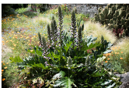
l'acanthé en majesté