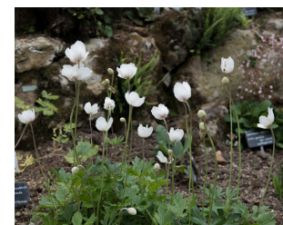
anémone sylvestre Est Europe