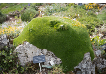
Arenaria pungens arénaire piquante Espagne