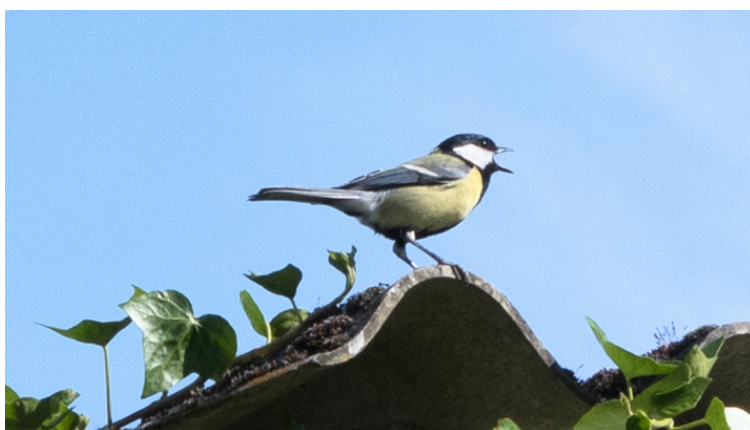
la mésange surveille les alentours de son nid installé dans une anfractuosit  du mur du hangar