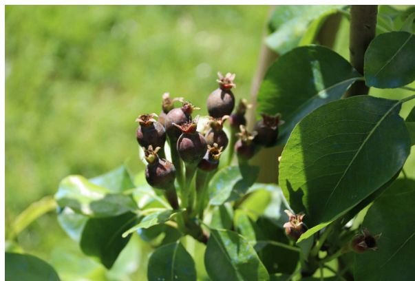
Eclaircir les fruitiers rendez-vous le 28 juin