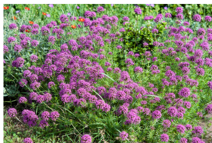
crucinella une vivace mellifère sans souci

Tuteurer les marguerites, les fagoter à la hâte avant l'averse: choisir un joli bâton et une jolie ficelle. Eviter les voyantes ficelles « bleu-plastic » !