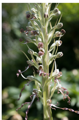
Quand la pelouse respire l'orchis pyramidal(rose) et l'orchis bouc pointent !