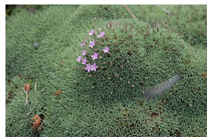
Dianthus arpadianus ssp. pumilus oeillet nain Turquie