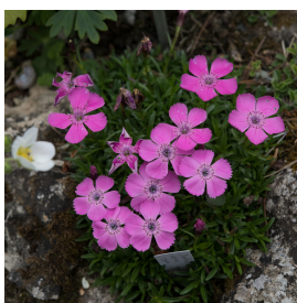
Dianthus alpinus oeillet Alpes