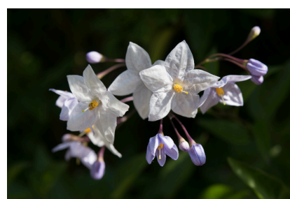
le solanum jasminoïde fleurit malgré un vent d'est un peu frais