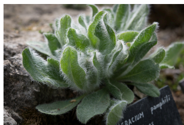
Hieracium pamphili épervière. Alpes