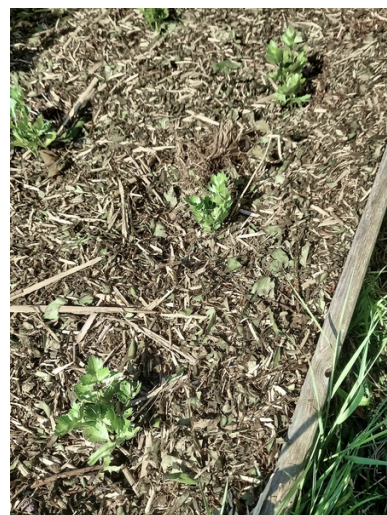
Paillage du céleri avec ce même broyat

Après les pois de printemps mettre des choux d'hiver par exemple, exigeants en azote. Laisser les racines des pois en place, utiliser leurs fanes en paillage.