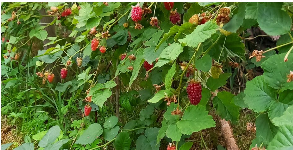
La muroise, croisement très productif de mûre et de framboise.

Un verger de petits fruits est intéressant à plus d'un titre !