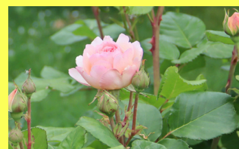
Oter les fleurs fanées facilite la refleuraison des rosiers

Laissez donc votre pelouse respirer, gardez la tondeuse dans la remise !