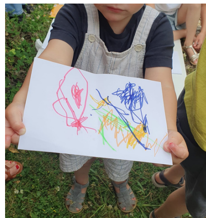
Le 14 juin au Parc (p.4)

Arroser généreusement aide à supporter la chaleur mais il ne fait pas baisser la température !