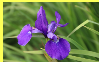
Profiter des iris. Fanés il faut couper les fleurs, pas les feuilles. Les réserves auront ainsi tout l'hiver pour migrer dans le rhizome. Ils refleuriront l'an prochain !