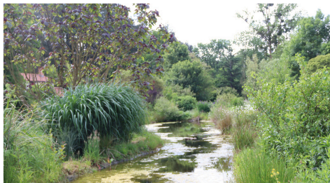
Et au milieu coule une rivière

Pour information leur site : jardinsdugue.eu/