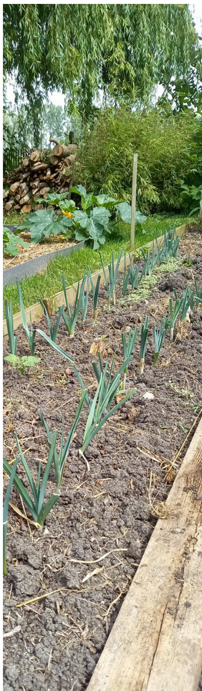
Le potager est paré pour les soupes hivernales : pommes de terre poiraux, courgettes.