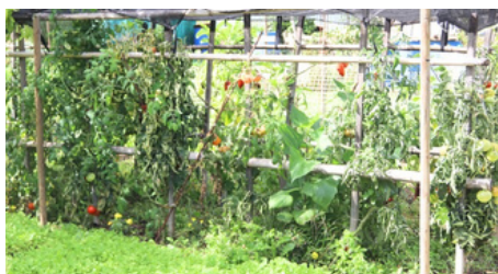
Les tomates se « déplument » petit à petit.