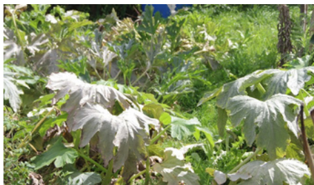
L'oïdium s'occupe des courgettes.

Les quelques averses début septembre emportent les jardins du quai de Belle-Ile vers l'automne.