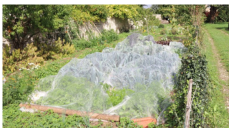
Le voile anti-insectes protège poireaux et carottes.