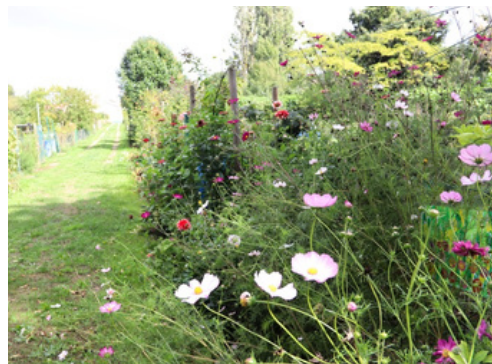
Les jardins reflorissent avec la douceur de cette fin d'été !