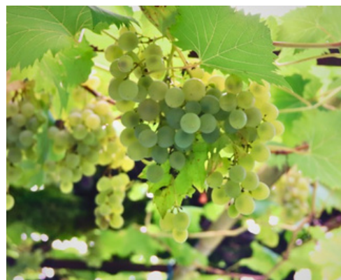
Le raisin est presque bon pour la dégustation.